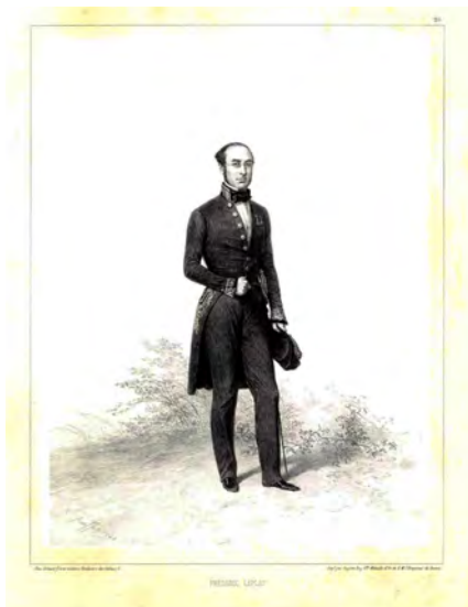
Fig. 2 – Frédéric le Play