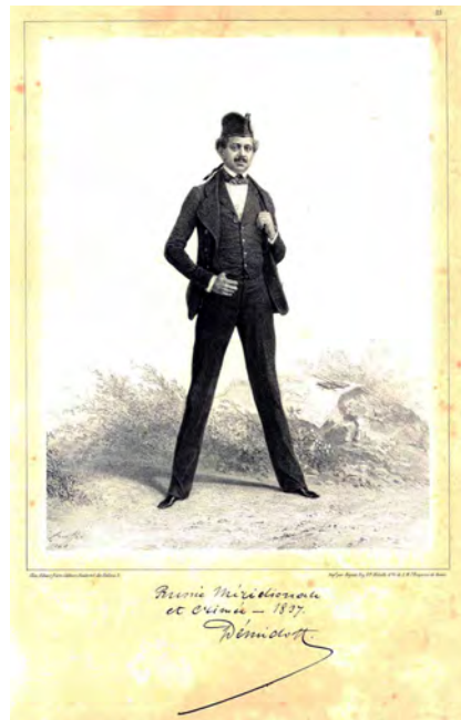
Fig. 1 – Anatole Demidoff

d'études anticipatrices est une juste réparation. Il faut également reconnaître que l'activité qu'il a déployée inlassablement attendu service aux relations culturelles entre la Russie et l'Occident.